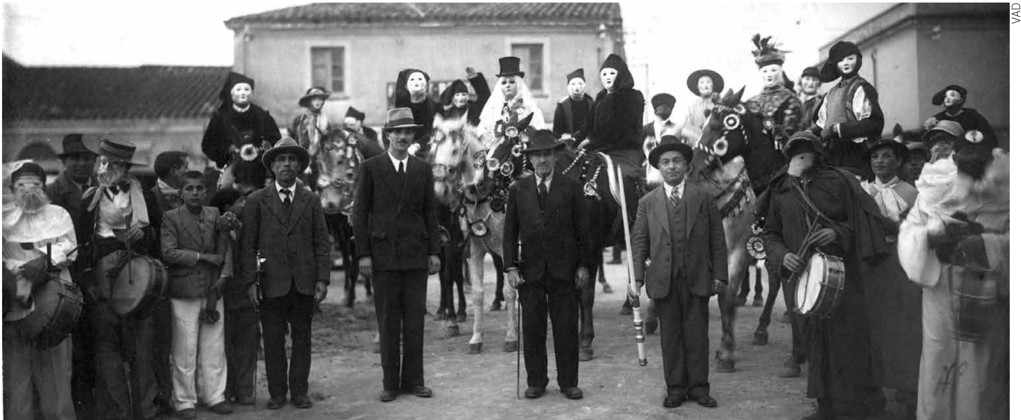
Sartiglia je karnevalska igra, a ta tradicija je opstala više od 500 godina

i ona ih je tada vodila i na Sartigliu. Među tom djetom bio je jedan dječak iz Cetinske krajine, danas je ravnatelj OŠ Knin, koji je, kada se vratio kući, u VAD-u ispričao što je tamo vidio i mi smo stupili u kontakt s njima i tako je pokrenuta suradnja – kaže dr. Dukić.