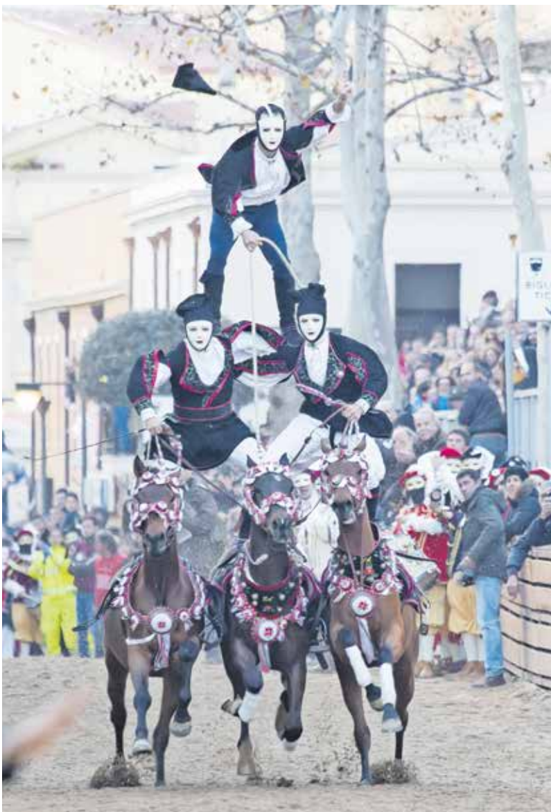
U povorci i natjecanju sudjeluje 120 konjanika, a Sartigliu prati 100 tisuća gostiju