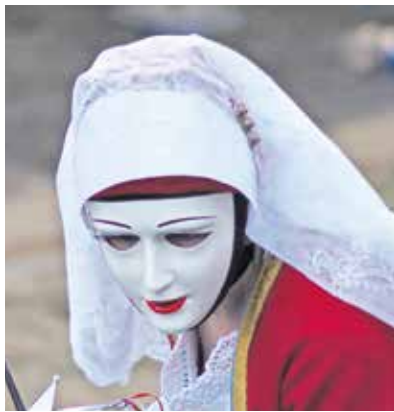
Nakon stavljanja maske stavlja se veo kao ženski dio nošnje, a na njega ide cilindar kao muški dio. To je simbolika muško-ženskih odnosa koji se u maski izjednačuju